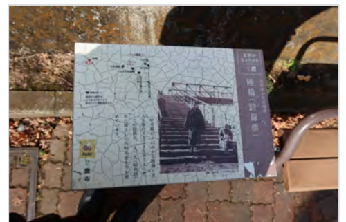
太宰治が生きた町である事を感じます